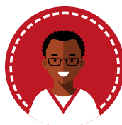
Infermiere Infermiere Pediatrico