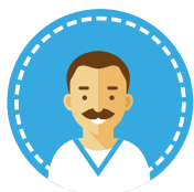
Infermiere Generico Infermiere Psichiatrico