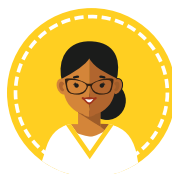
Fisioterapista Educatore Tecnico Riab. Psichiatrica