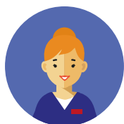
Coordinatore: Caposala: tasca profilo rosso Capotecnico: tasca profilo bianco Capo-Ostetrica: tasca profilo lilla