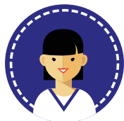
Studente: Infermieristica Fisioterapia Igiene Dentale