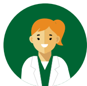
Medico – Odontoiatra

In quanto istituto universitario sono presenti studenti e specializzandi.