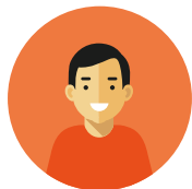
Personale per le pulizie in sala operatoria

In Ospedale operano anche volontari affiliati ad Associazioni di Volontariato riconosciute. Il personale è identificabile attraverso apposita targhetta.