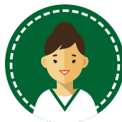
OSS – OTA Ausiliario