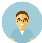
Personale di: Fisica Sanitaria Ingegneria Clinica