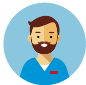
Biologo, Farmacista, Pers. San. Aree Intensive Infermiere: taschino profilo rosso OSS, OTA, Ausiliario: taschino profilo verde Tecnico Sanitario: taschino profilo bianco