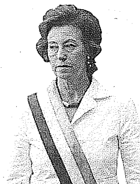
Con la fascia Il sindaco di Milano Letizia Moratti