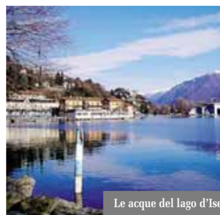
Le acque del lago d'Isèo

Sul sito Internet, all'indirizzo www.balneazione lagoiseo.it è possibile trovare le informazioni sul lago d'Isèo e verificare quali sono le località balenabili.