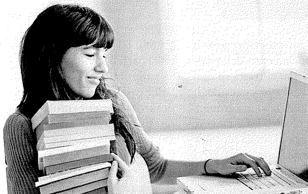
CORSA AL RISPARMIO Sopra, una studentessa acquista un libro usato. A sinistra, la ricerca dei volumi di seconda mano anche on line.